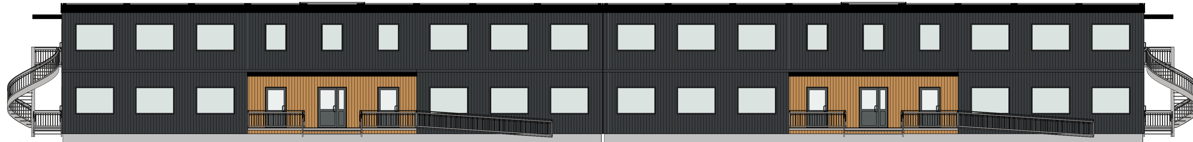
Sør 1 : 100