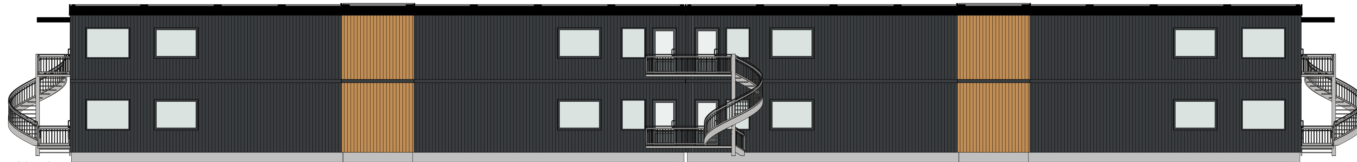
Nord 1 : 100

Himmelretninger stemmer ikke nødvendigvis med reell plassering. For plassering se situasjonsplan