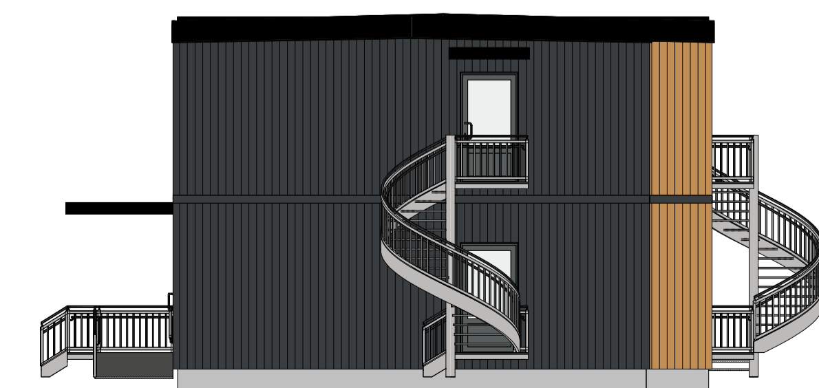
Øst 1 : 100